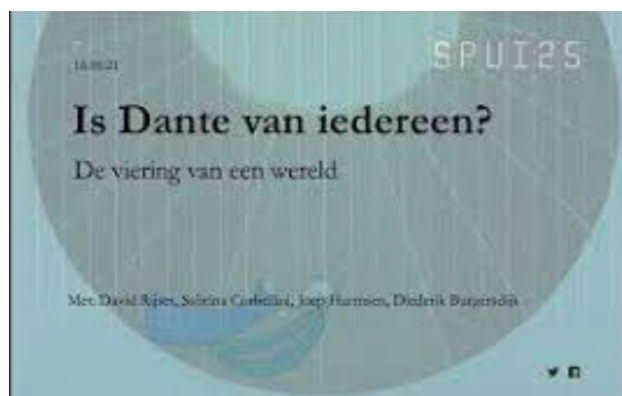
Beginbeeld bijeenkomst SPUI25 De viering van een wereld , 14 september.